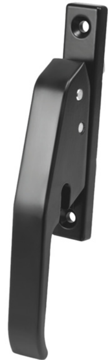
Монтажное отверстие замка-рычага