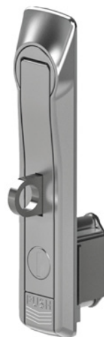
Версия с ухом